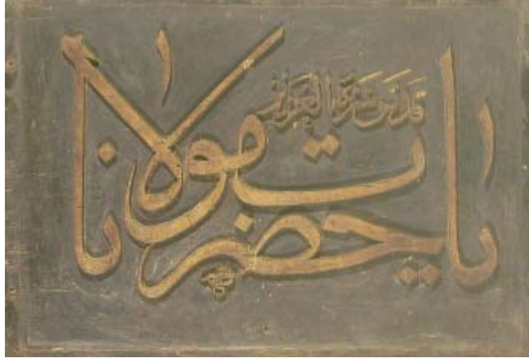
Resim 2: Manisa Müzesi'nden "Yâ Hazret-i Mevlâna" istifli bir yazı