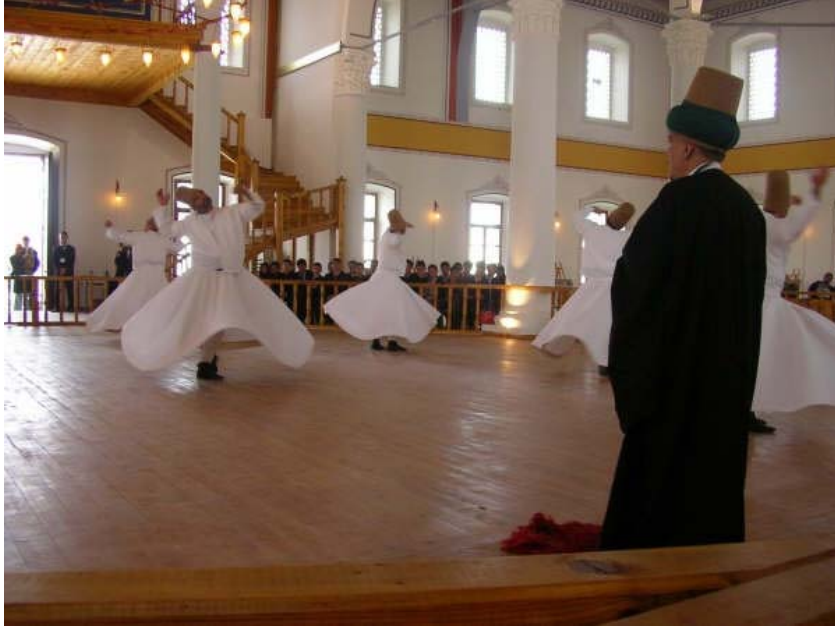
Resim 8. Gelibolu Mevlevihânesi genel görünüş