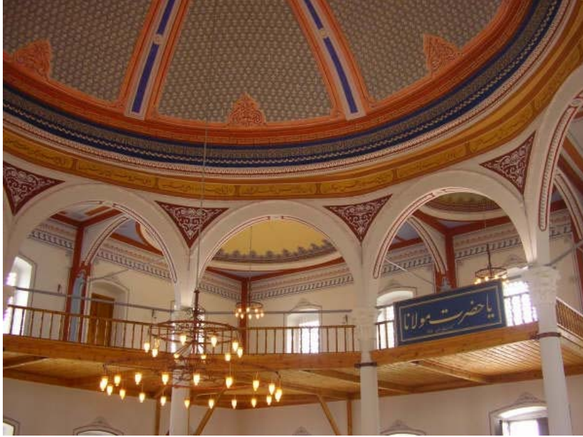
Resim 7. Gelibolu Mevlevihânesi genel görünüş