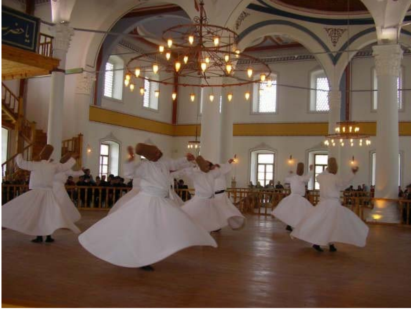
Resim 9. Gelibolu Mevlâhânesi genel görünüş