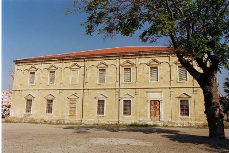
Resim 2. Gelibolu Mevlevihanesi genel görünüş