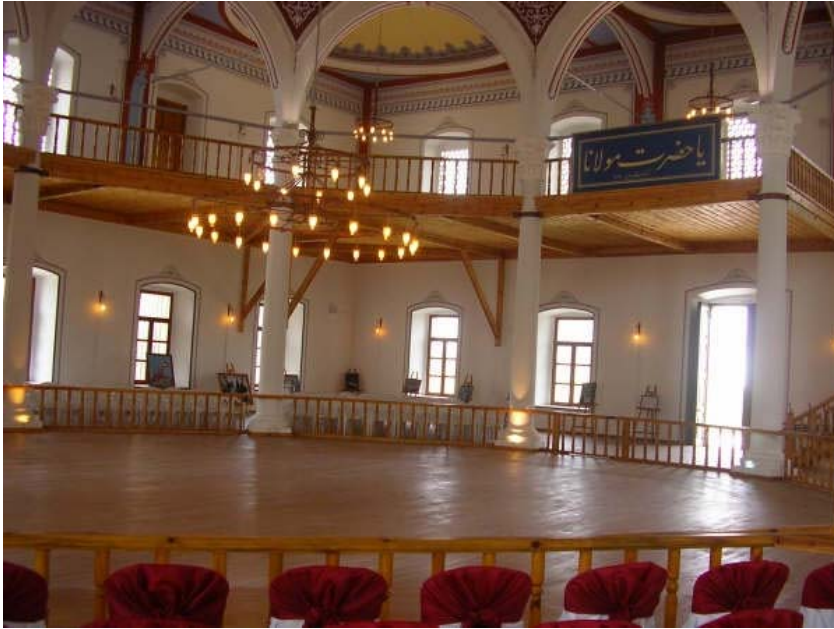
Resim 6. Gelibolu Mevlâhânesi genel görünüş