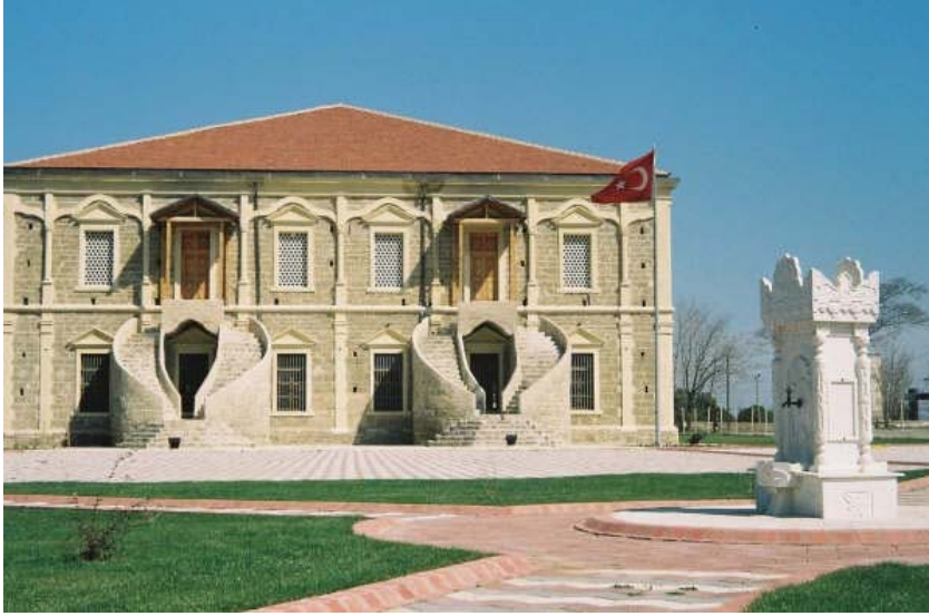
Resim 5. Gelibolu Mevlâhânesi genel görünüş