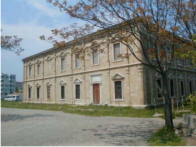
Resim 1. Gelibolu Mevlevihanesi