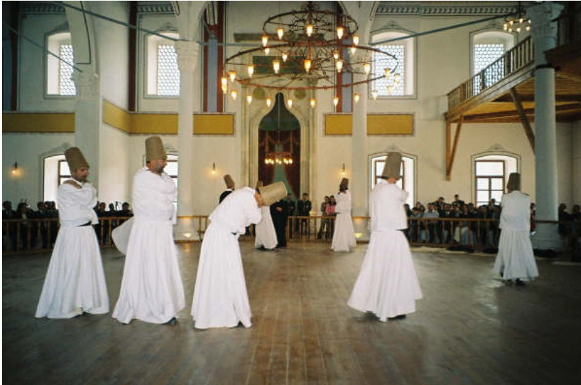
Resim 10. Gelibolu Mevlâhânesi genel görünüş