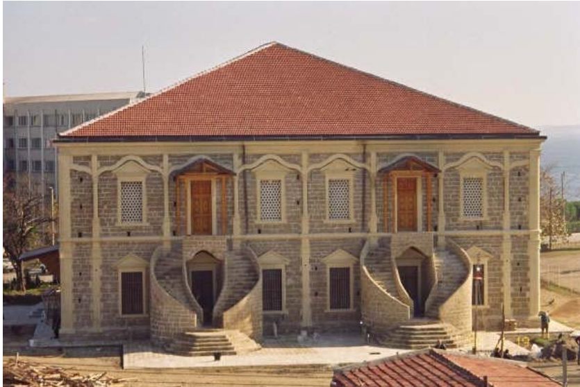
Resim 4. Gelibolu Mevlevihânesi genel görünüş