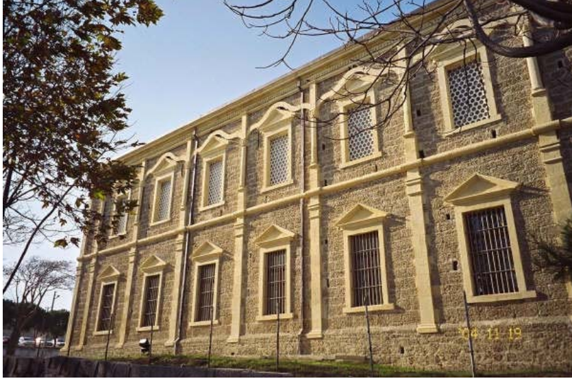
Resim 3. Gelibolu Mevlevihânesi genel görünüş