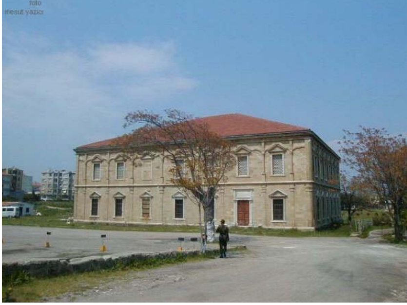
Resim 11. Gelibolu Mevlevihanesi güney genel görünüşü