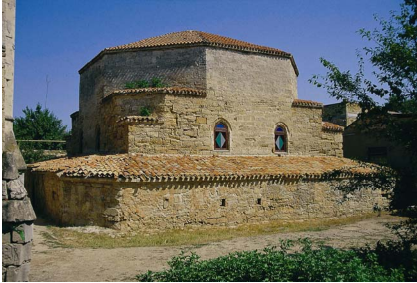
Resim5: Gözleve Mevlevîhânesi, genel görünüş.