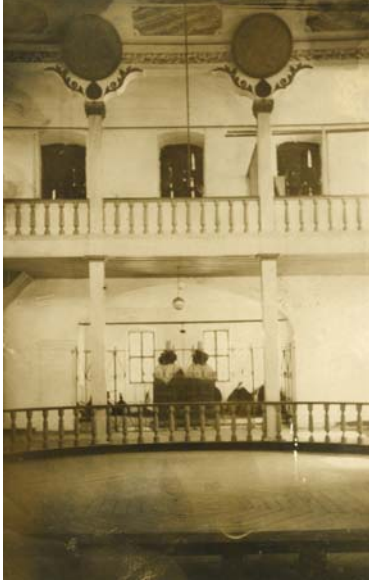
Resim8: Hanya Mevlevihânesi, içten görünüş (Kara'dan).