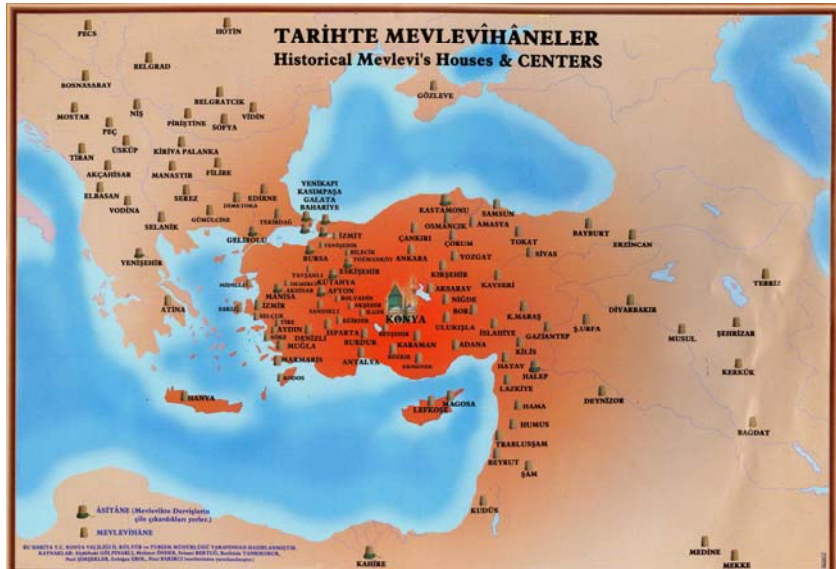
Resim2: Mevlîhâneler Haritası (Şimşekler'den).