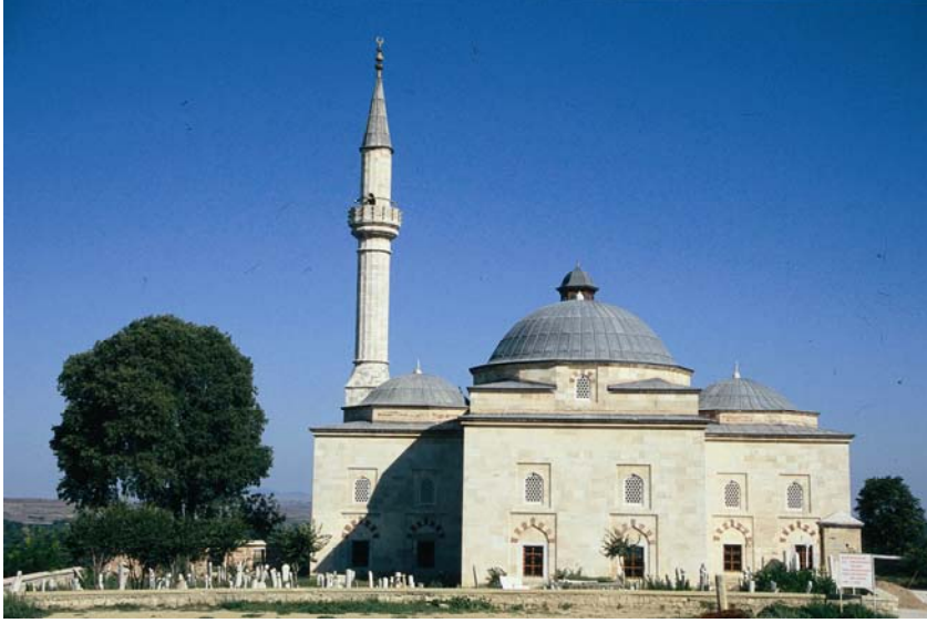
Resim3: Edirne Mevlâhânesi, genel görünüş.