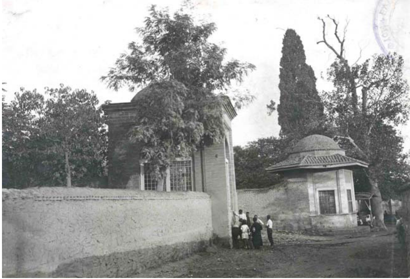
Resim9: Selanik Mevlevihânesi, genel görünüş.