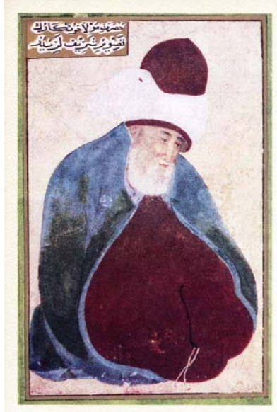
Resim1: Anonim Mevlâna Minyatürü.