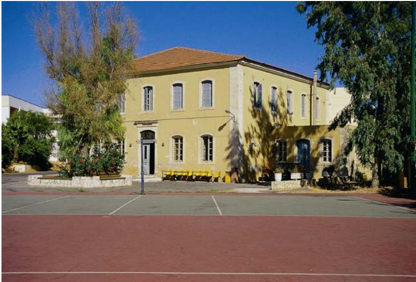
Resim7: Hanya Mevlevihânesi, genel görünüş.