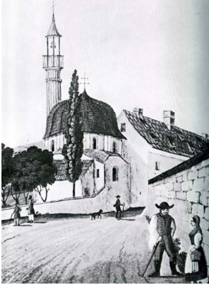
Resim4: Peçoy Yakovalı Hasan Paşa Mevlevîhânesi, genel görünüş.