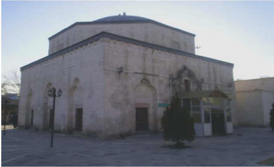
Resim 5 – 6

2004 yılında restorasyonu tamamlanan ve halen camii olarak ibadete açık olan mevlvîhâne'den görünümüler.