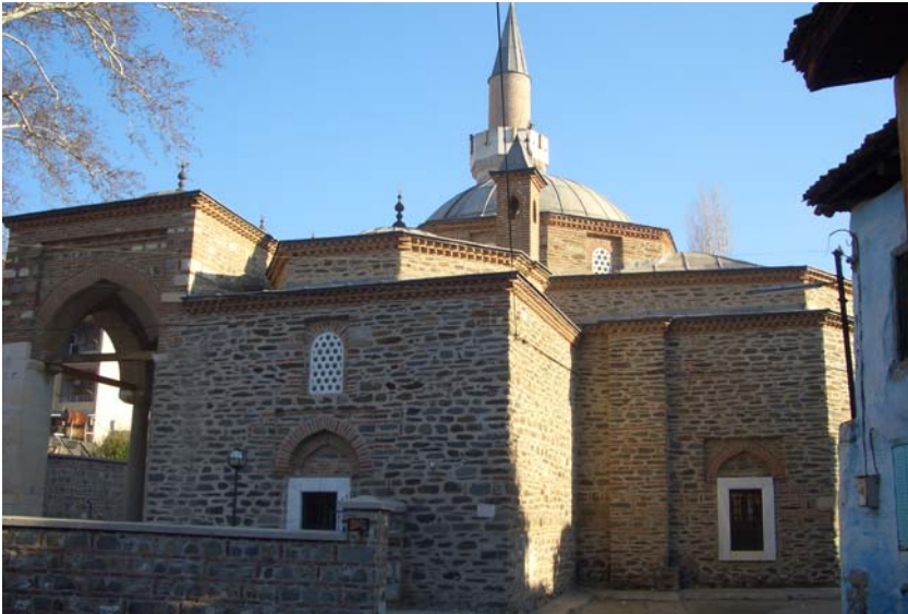
Resim: Tire Mevlevîhânesi