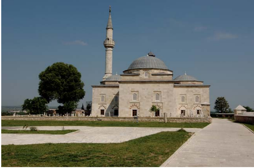
Resim: Edirne Muradiye Camii