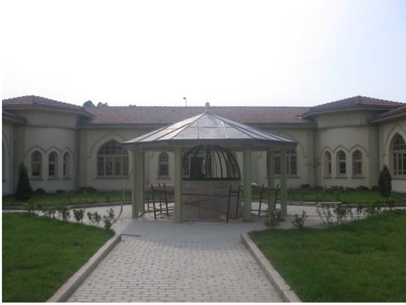
Resim: İstanbul Yenikapı Mevlevîhânesi