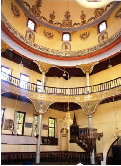
Resim: Kütahya Dönenler Camii