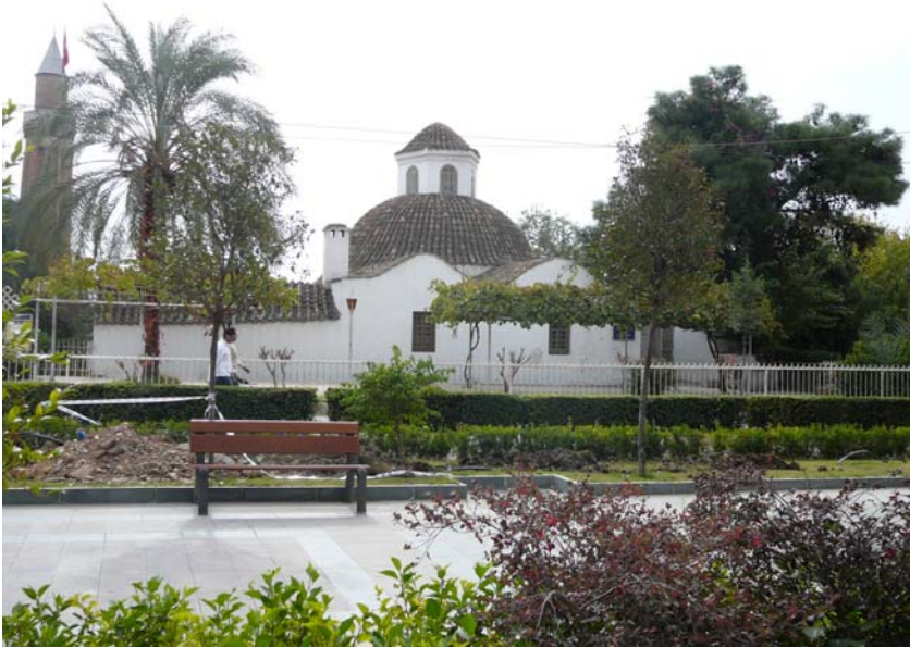
Resim: Antalya Mevlevihanesi