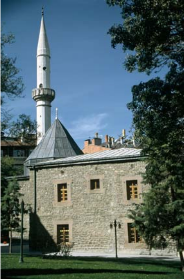
Resim: Konya Şems-i Tebrizî Zaviyesi