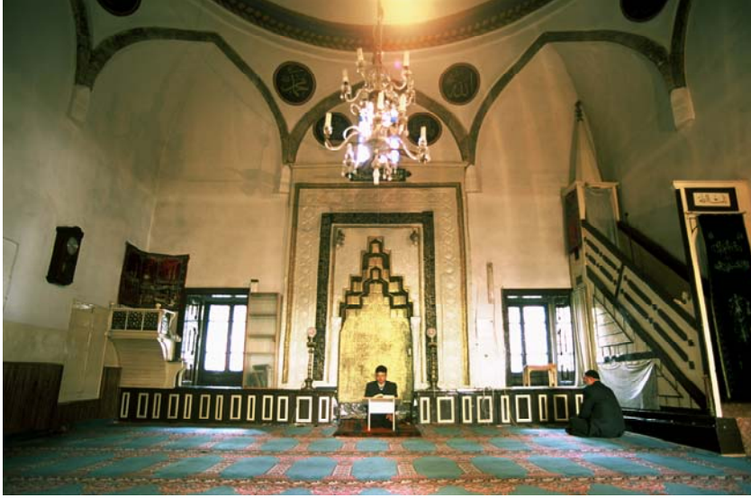
Resim: Konya Pirî Mehmet Paşa Zaviyesi