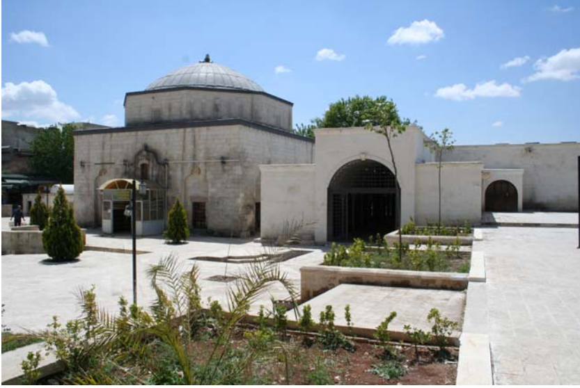
Resim: Şanlıurfa Mevlevîhânesi