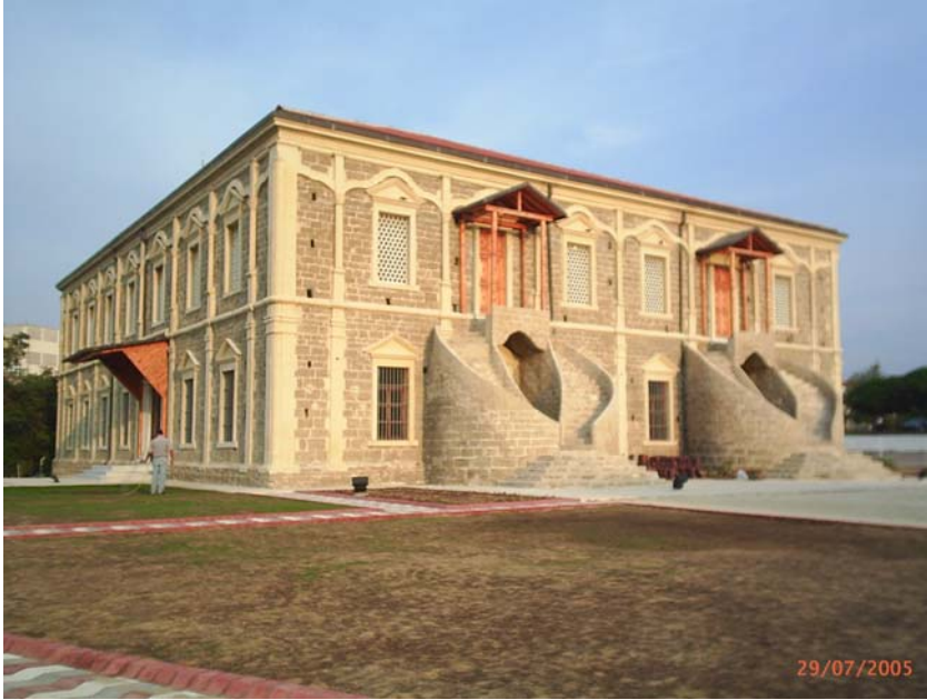
Resim: Gelibolu Mevlevihanesi