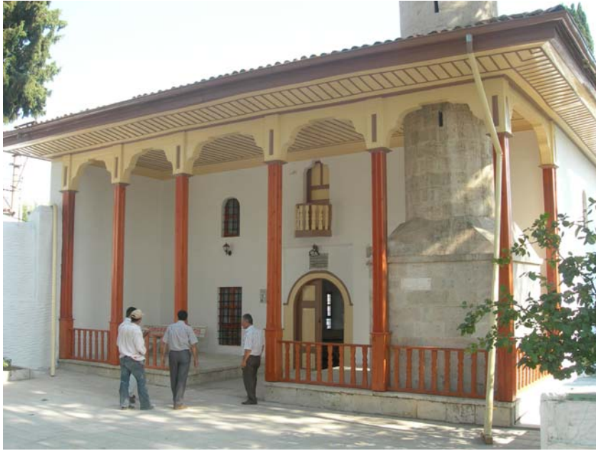
Resim: Muğla Mevlevihânesi