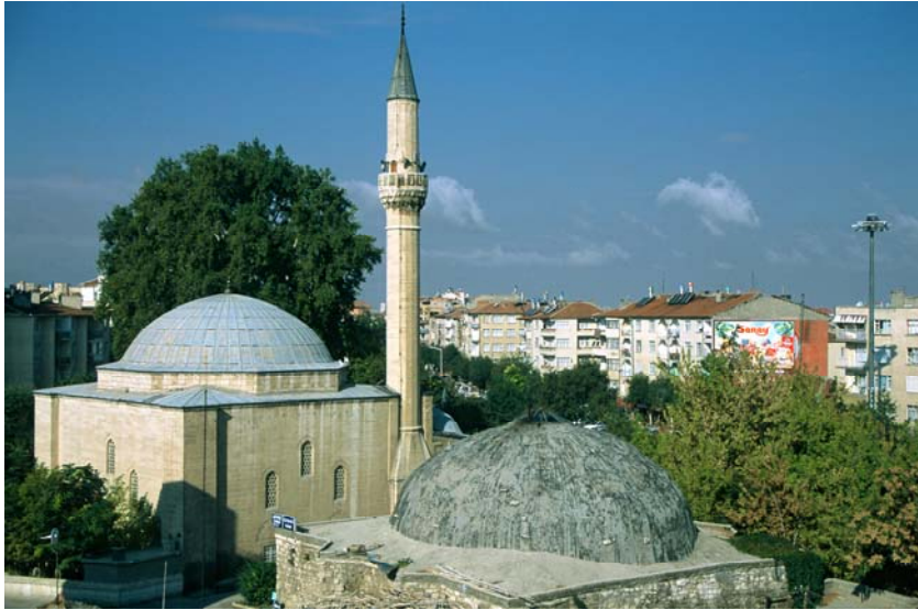
Resim: Karaman Mevlevîhânesi