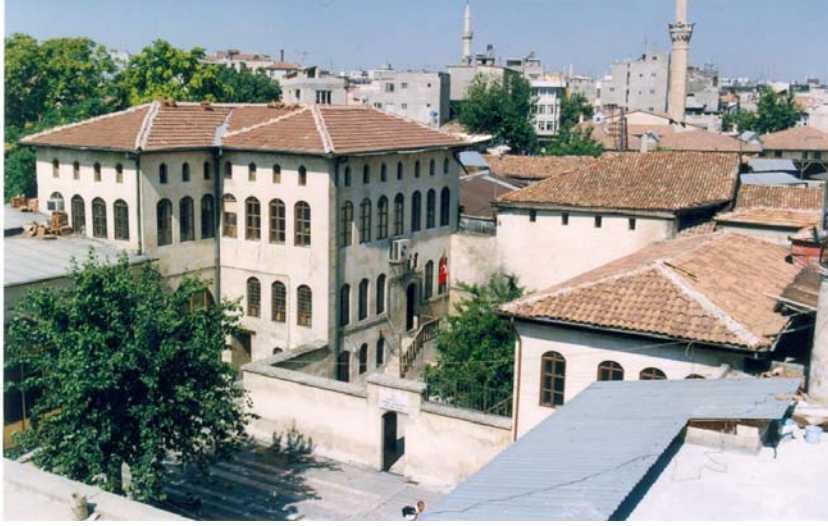
Resim: Gaziantep Mevlevihanesi