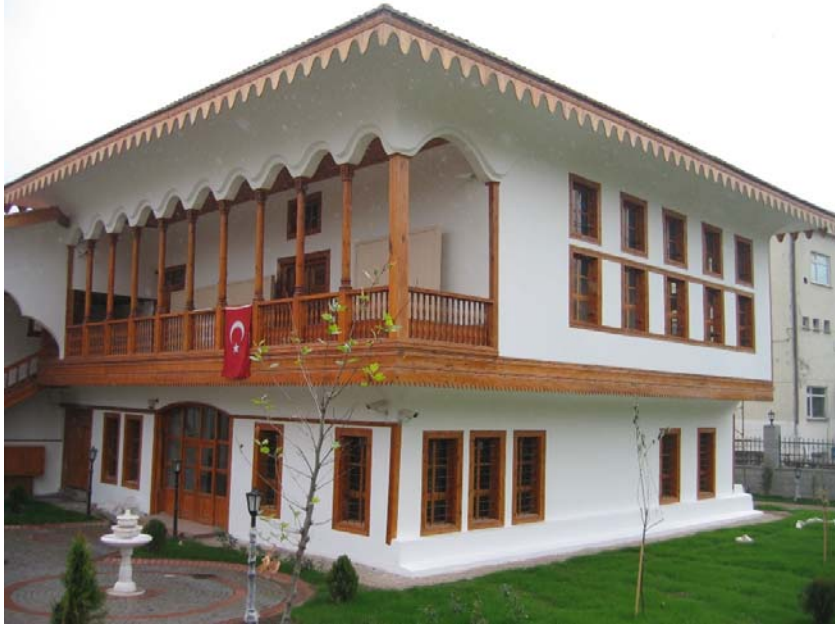
Resim: Tokat Mevlevihânesi