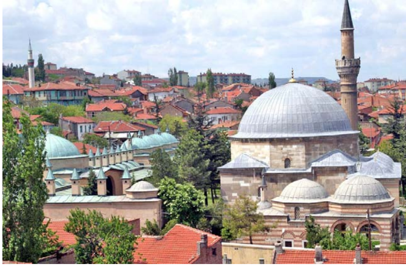
Resim: Eskişehir Kurşunlu Külliyesi