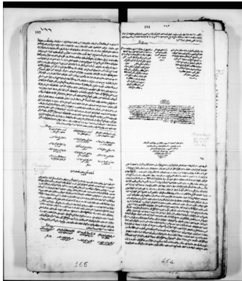
Resim: Tire Mevlevîhânesi vakfiye resimleri: Yahşi Bey 2